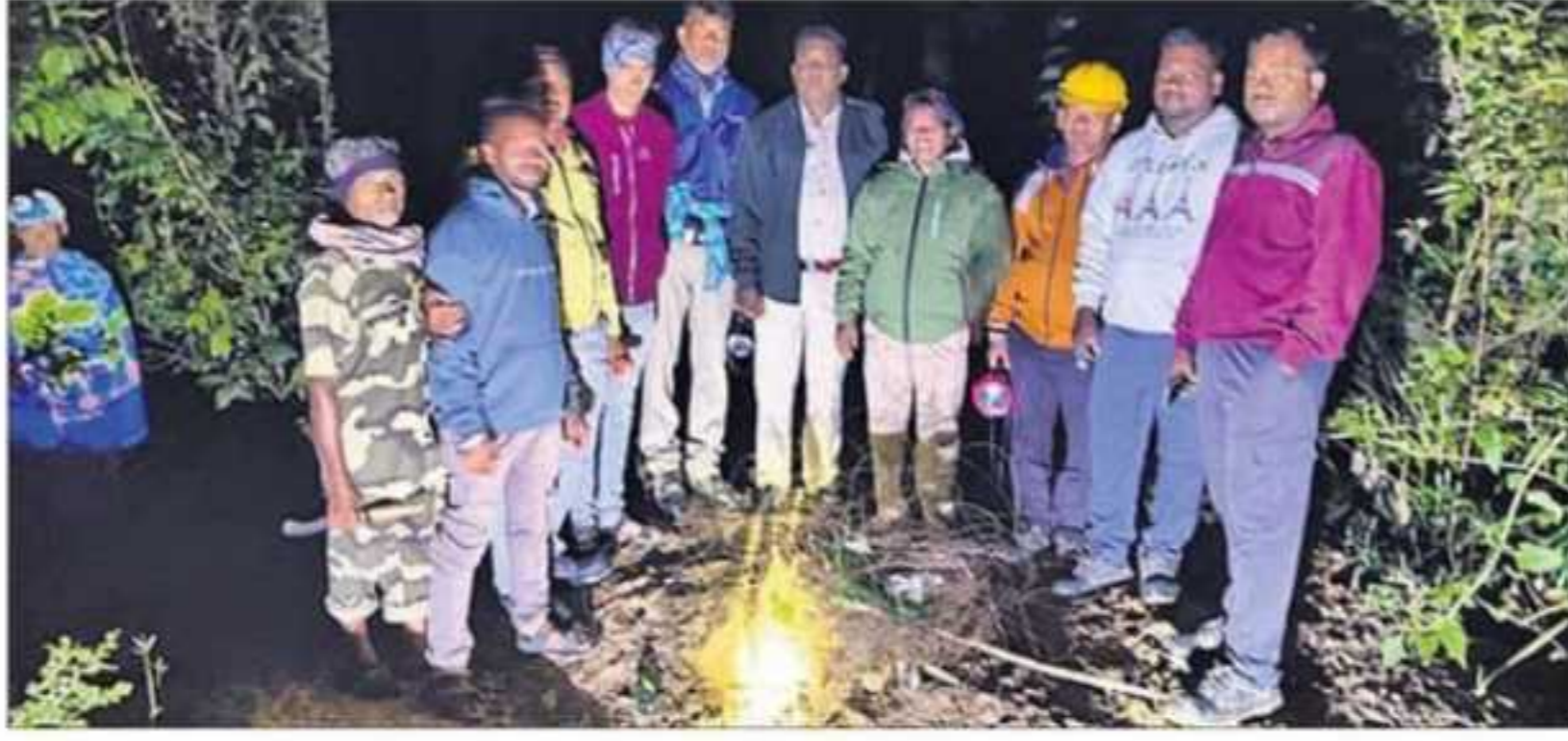
ବନବିଭାଗ ଓ ଟିପିଏସ୍‌ଓଡିଏଲ ପକ୍ଷରୁ ପାଟ୍ରୋଲିଂ କରାଯାଇଛି ।