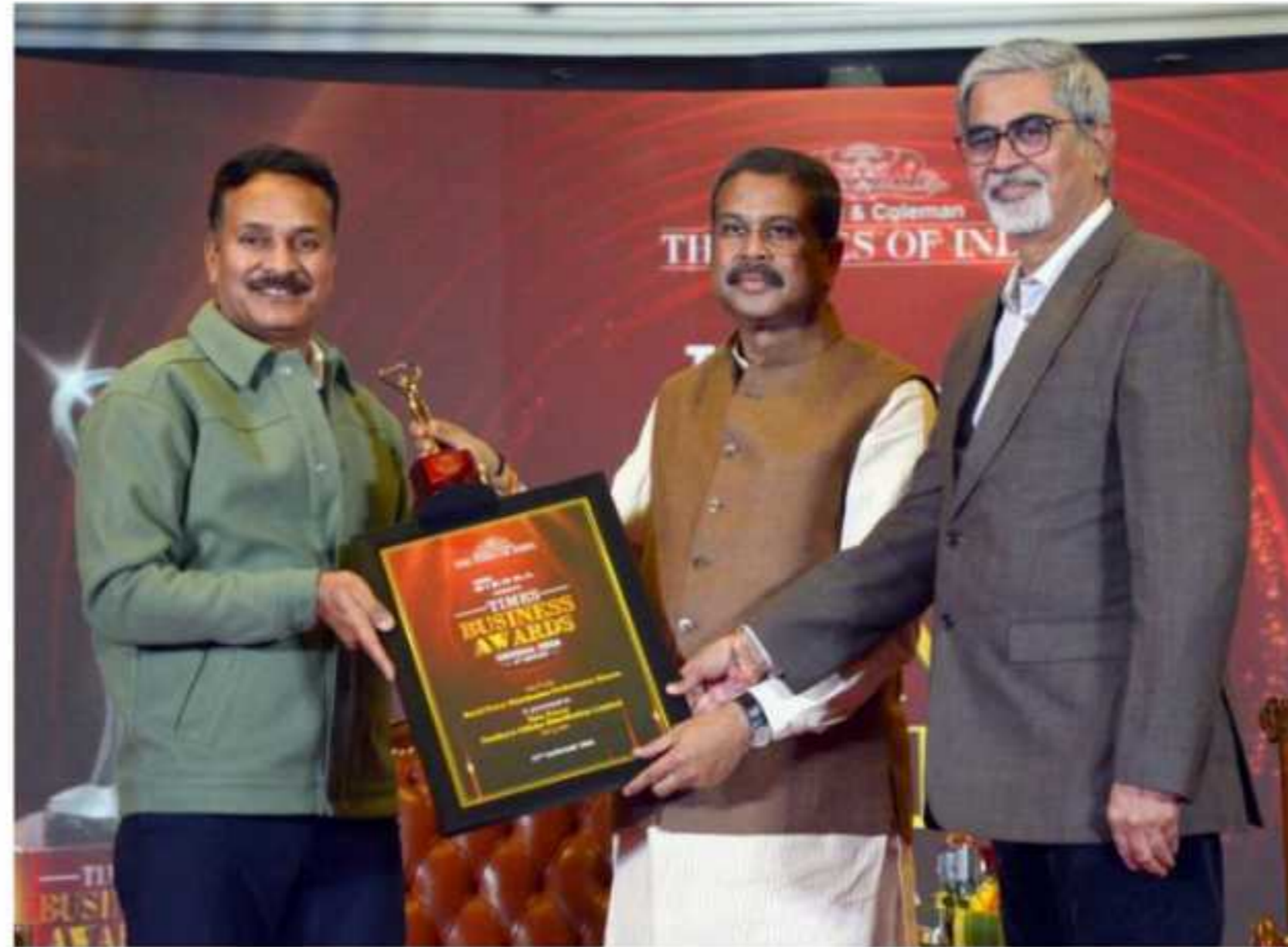
ଟିପିଏସ୍‌ଓଡିଏଲକୁ ମିଳିଲା ଟାଇମ୍ସ ବିଜନେସ୍ ଆଓର୍ଡ