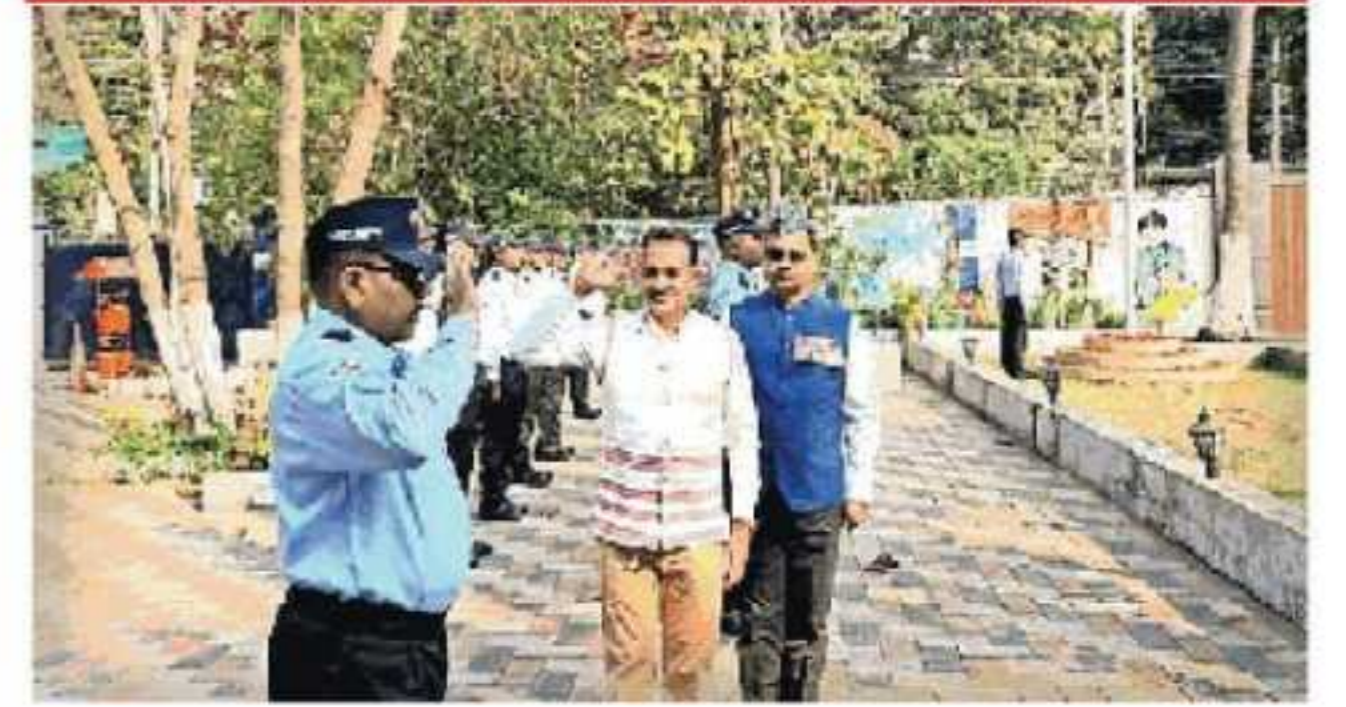
गणतंत्र दिवस के अवसर पर झंडातोलन करते टीपीएसओडीएल के सदस्य

● सौर ऊर्जा योगदानकर्ताओं का सम्मान, विकसित भारत हेतु एकजुटता का संदेश