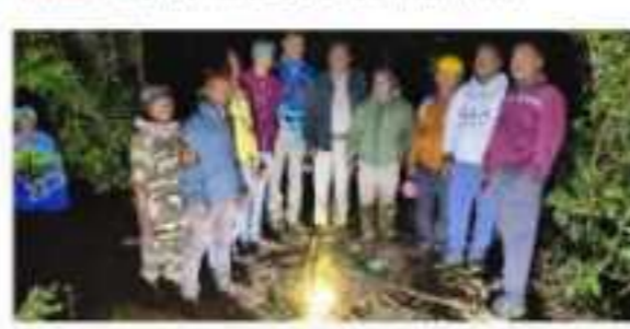
Bhairampur: TP Southern Odisha Distribution Limited (TPSODL) on Wednesday stated that it has launched a comprehensive wildlife protection and anti-poaching drive across forest and crop-field areas of Southern Odisha.

The initiative reinforces TPSODL's commitment to environmental conservation while ensuring safe and reliable power distribution. Through infrastructure upgrades, joint patrolling, and community engagement, the company is working to safeguard wildlife and forest ecosystems. The company said in a press statement.