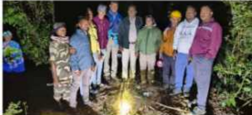
ଦକ୍ଷିଣ ଓଡ଼ିଶାରେ ବନ୍ୟପ୍ରାଣୀଙ୍କ ସୁରକ୍ଷା ପାଇଁ ଚୈଦ୍ୟସ୍ୱତ୍ୱିଏଲ୍ ତରଫରୁ ବ୍ୟାପକ ଅଭିଯାନ।

Name / Odisha News / ପରି ସଂକଳନ ବ୍ୟବହାର ପ୍ରକାଶ ପାଇଁ ଦୟାକରି ଅନୁମତି ଦିଅନ୍ତୁ। ଦକ୍ଷିଣ ଓଡ଼ିଶାରେ ବନ୍ୟପ୍ରାଣୀଙ୍କ ସୁରକ୍ଷା ପାଇଁ ଚୈଦ୍ୟସ୍ୱତ୍ୱିଏଲ୍ ତରଫରୁ ବ୍ୟାପକ ଅଭିଯାନ