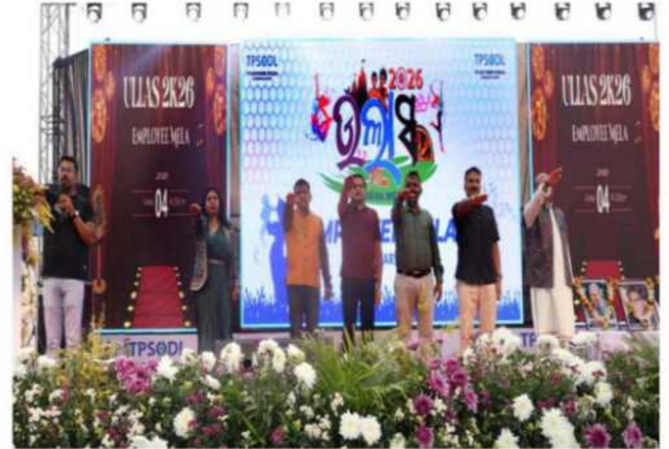
ଟିପିଏସ୍‌ଡିଏଲ୍ ଚରଫରୁ ବାର୍ଷିକ କର୍ମଚାରୀ ମେଳା "ଉଲ୍ଲାସ-୨୦୨୬" ପାଳିତ

ବ୍ରହ୍ମପୁର, ରାଜ୍ୟ: ଟିପିଏସ୍‌ଡିଏଲ୍ ଚରଫରୁ ବାର୍ଷିକ କର୍ମଚାରୀ ମେଳା - ଉଲ୍ଲାସ ୨୦୨୬ ପାଳନ କରାଯାଇଛି । କର୍ମଚାରୀ ପକ୍ଷରୁ ଆୟୋଜିତ ଏହି ବାର୍ଷିକ ଉତ୍ସବରେ ସମସ୍ତ କର୍ମଚାରୀ ଏବଂ ସେମାନଙ୍କ ପରିବାରବର୍ଗ ଉତ୍ସାହ, ଆନନ୍ଦ ଓ ଏକତା ଭାବନା ଦେଖାଯାଇଥିଲା ।